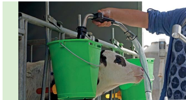
사용이 간편하고 용이한 급이량 측정장치