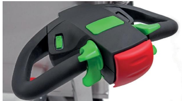
모든 기능들이 통합된 드로바 형 손잡이

밀크 모빌 4x4 는 믹서, 히터, 탱크 세척기능, 사용자 친화적 조정장치, 급이량 조절, 전/후진 주행 시스템, LED 램프를 갖추고 있습니다.