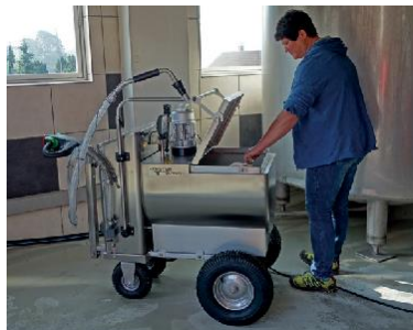
중탕기가 달린 수평형 탱크

포스터에서 개발한 밀크모빌은 독립된 우리 또는 이글루형 우리의 송아지들에게 개별적으로 급이하는데 있어, 많은 시간과 노력을 아껴줄 유용하고 용이한 장비입니다. 밀크모빌을 사용하면, 분유를 섞어서 데우고, 운송하며 알맞은 용량으로 급이 작업이 훨씬 수월하고 빠르게 이루어 질 수 있습니다. 120 리터, 200 리터 용량으로 판매되는 포스터사의 밀크모빌 4x4 는 어떤 크기의 목장에도 적합하게 사용될 수 있습니다.